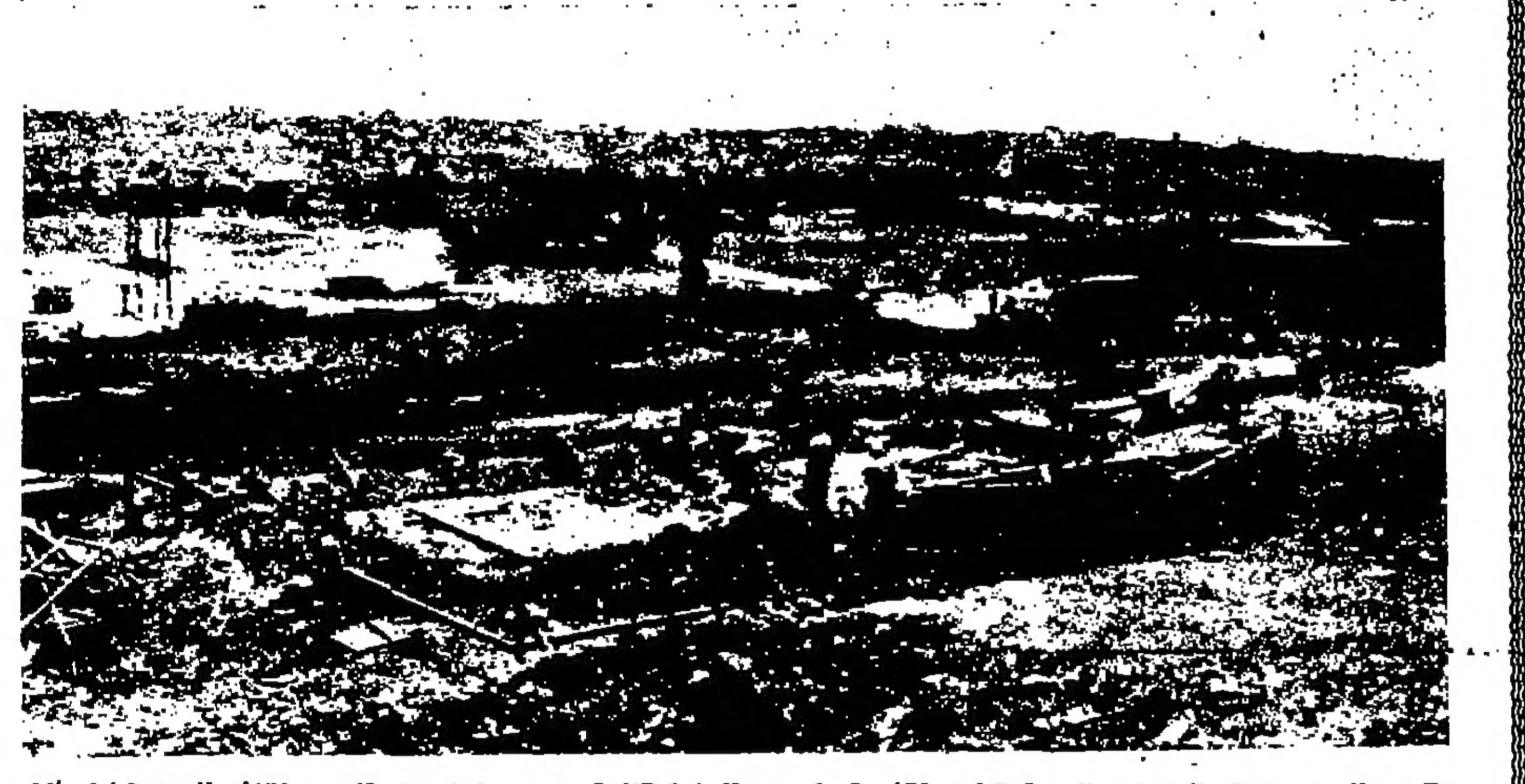
بالت «المصور» هذه الصورة : والصورة الاخرى القصور على الصفحة الاخيرة . من مراسل اجبري حاتم من القنصل الى تل ابيب اسرائيل . وقد التقطت الصورة لعملية حفر الاساسات للتمسك بالحق سطات الاحتلال اشباعها لاسكان العائلات اليهودية فيها في الشيخ جراح القدس الغربية